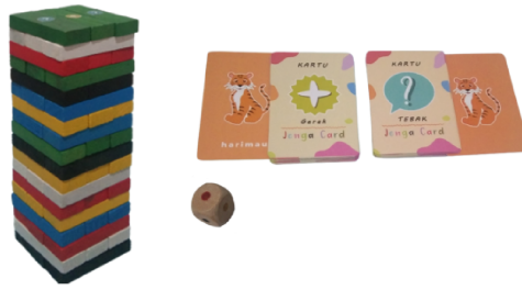
GAMBAR 2. Permainan Smart jenga